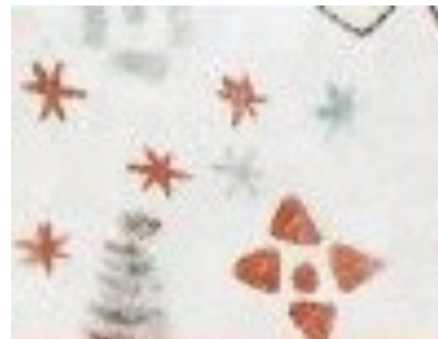
Forskellig slags stjernemønstre.

Et af Elmelundemesterens særpræg er hans brug af små figurer i billedet. Stjerner og andre symboler. Ved at lave samme slags figurer kan eleverne give deres skitser et tydeligt kalkmaleri-præg.