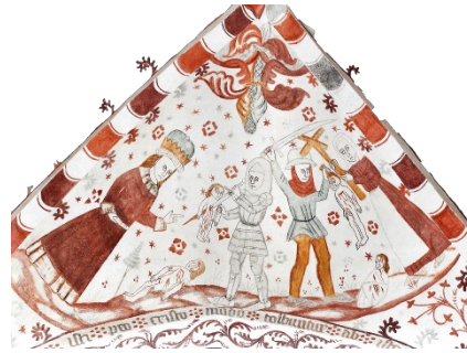
Tre-farvet bord med filigran.

Motiverne er oftest malet i loftets hvælvinger. Og den høje kant der afgrænser hvælvningerne fungerer som indramning. Her har Elmelundemesteren malet kanten i et to eller tre-farvet mønster - evt. suppleret med et filigranmønster, der vokser ud fra kanten.