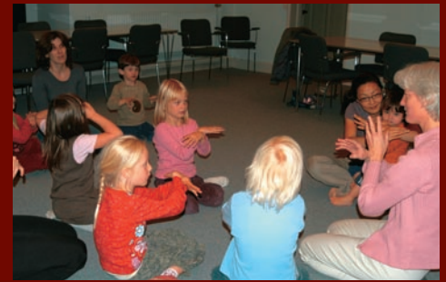
de muntre fugle kalder på hverandre;