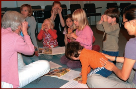
Nu titte til hinanden