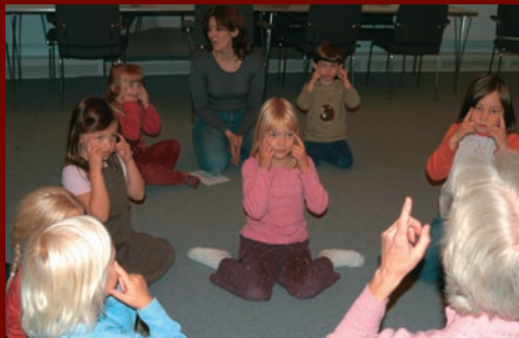
nu alle jordens børn deres øjne opslå,