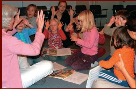
de favre blomster små,