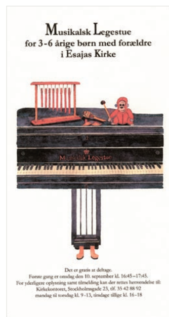
Design: Ann-Kristin Hauge

Foruden omtale i kirkebladet, blev der sendt personlige invitationer ud til alle børn, som er døbt i Esajas Kirke og stadigvæk bor i eller tæt ved sognet, og som nu har en alder mellem 3-6 år. Desuden blev der lavet en smuk plakat, som blev ophængt mange steder i lokalområdet. Senere er der kommet nye til ved "mund-til-mund" metoden.