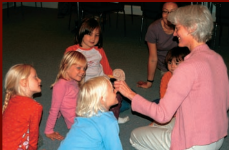
nu sneglen med hus på ryg...